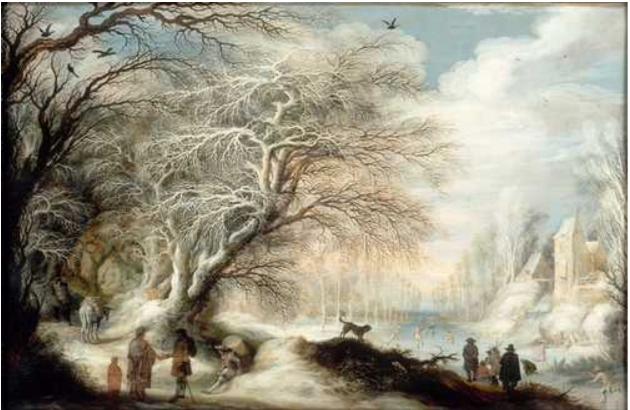
Gysbrecht Leytens, Paysage d'hiver avec gitans et patineurs , vers 1640

À la manière de Gysbrecht Leytens, créez votre paysage d'hiver !