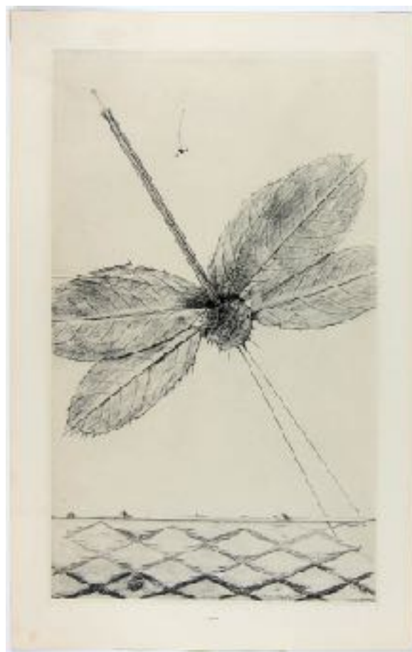
Les éclairs au-dessous de 14 ans